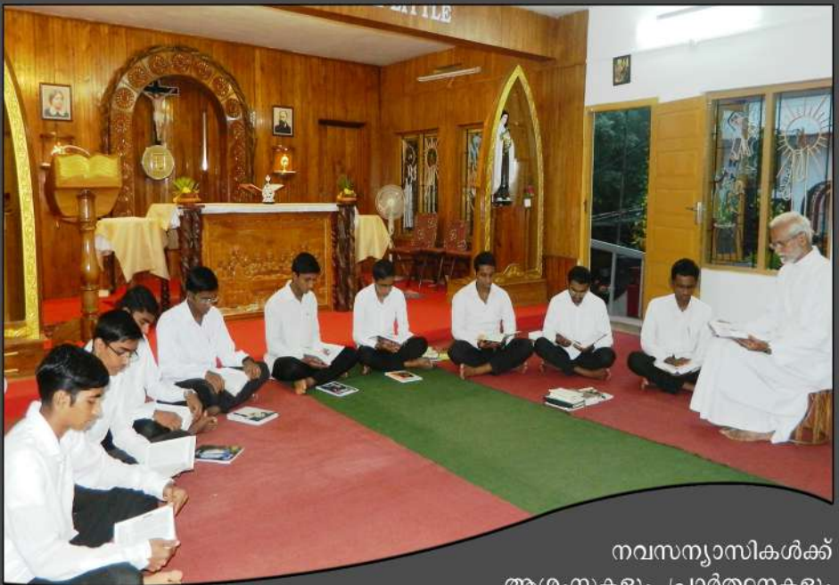
നവസന്യാസികൾക്ക് ആശംസകളും പ്രാർത്ഥനകളും