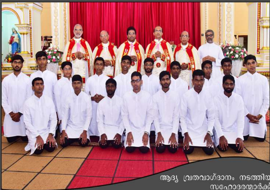
ആദ്യ വ്രതവാഗ്ദാനം നടത്തിയ സഹോദരന്മാർക്ക് ആശംസകൾ