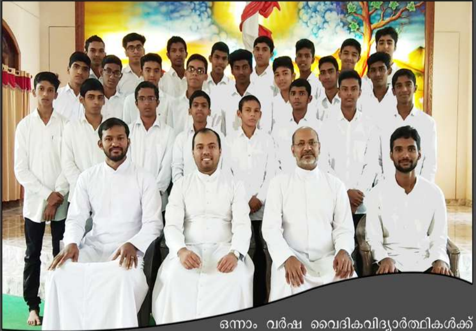
ഒന്നാം വർഷ വൈദികവിദ്യാർത്ഥികൾക്ക് ചെറുപുഷ്പ സഭയിലേക്ക് ഹൃദ്യമായ സ്വാഗതം